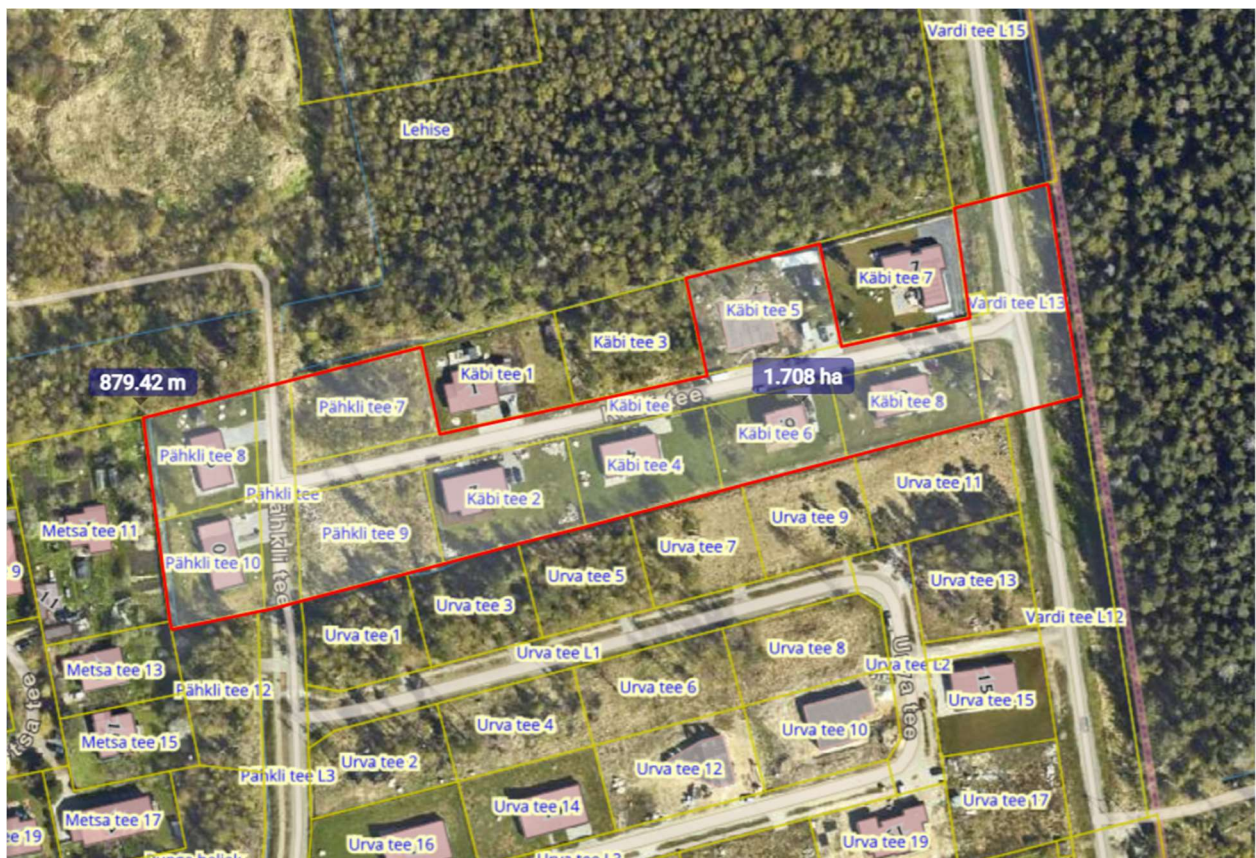
Joonis 2. Jaani-VI maaüksuse detailplaneeringu kehtiva planeeringuala asukohaskeem.